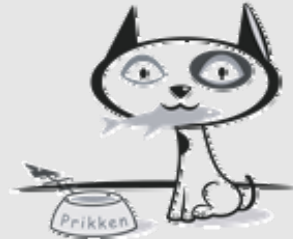
Prikken et .