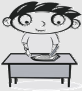
Leo skriv .

Verb fortel kva som skjer eller kva nokon gjer.