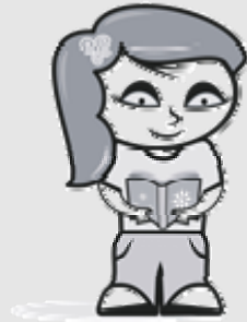
Luisa les .